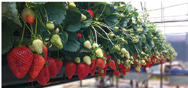
Piante di fragole trattate con RADIFLOR.

L'impiego di RADIFLOR ha ridotto sensibilmente il numero dei frutti deformi nei periodi di freddo più intenso.