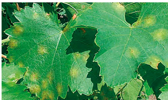
Effetti di Plasmopara viticola

PENTASYS-Cu accelera la defogliazione nelle colture frutticole (pesco, melo, pero, vite) in pieno campo e può essere efficacemente utilizzato come fonte di rame nelle soluzioni nutritive per fertirrigazione ed idroponia.